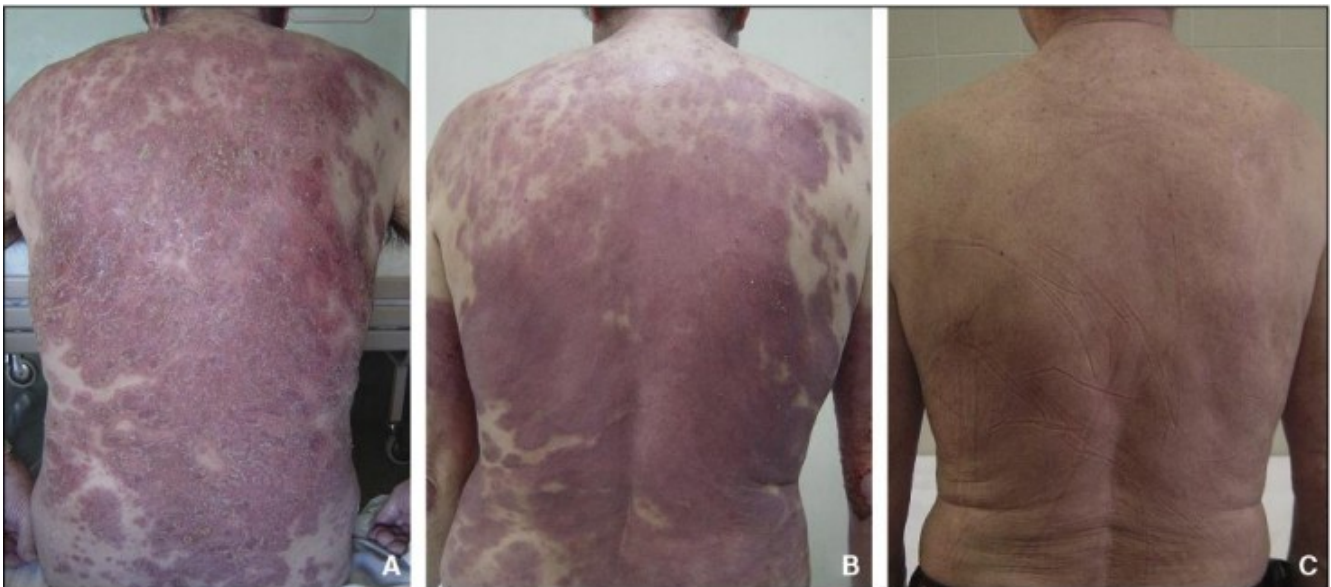
Patiënt met psoriasis, waarbij de psoriasis binnen 3 maanden verdwijnt met infliximab.

Apremilast is geen biological, maar een klein molecuul dat een stof remt die fosfodiesterase E4 heet. Indirect worden hierdoor de stoffen TNF- \alpha , IL-23, IFN-alpha, en IFN-gamma geremd. Hierdoor vermindert de ontsteking bij psoriasis. Otezla (apremilast) zijn tabletten. Er wordt gestart met een opbouwschema: dag 1: 10 mg, dag 2: 20 mg (2 x 10 mg) dag 3: 30 mg (10 mg + 20 mg), dag 4: 40 mg (20 mg + 20 mg), dag 5: 50 mg (20 mg + 30 mg), daarna 2 dd 30 mg. Voor het opbouwschema is een set met tabletten van 10, 20 en 30 mg beschikbaar.