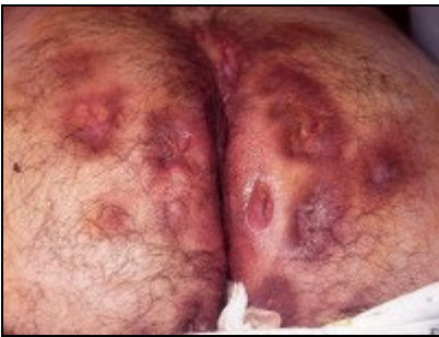
Hidradenitis suppurativa van de billen, ernstige variant met veel ontstekingsverschijnselen