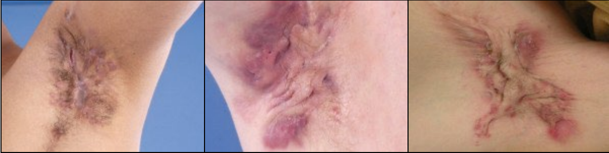
Hidradenitis suppurativa van de oksel, ernstige varianten