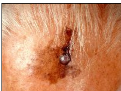
melanoom, ontstaan in een lentigo maligna

De prognose is goed, de kans dat er een melanoom ontstaat in een lentigo maligna is klein, en de kans dat er uitzaaiingen ontstaan is nog veel kleiner. Wel gebeurt het regelmatig dat de plek weer terugkomt, vaak aan de rand van het verwijderde gebied.